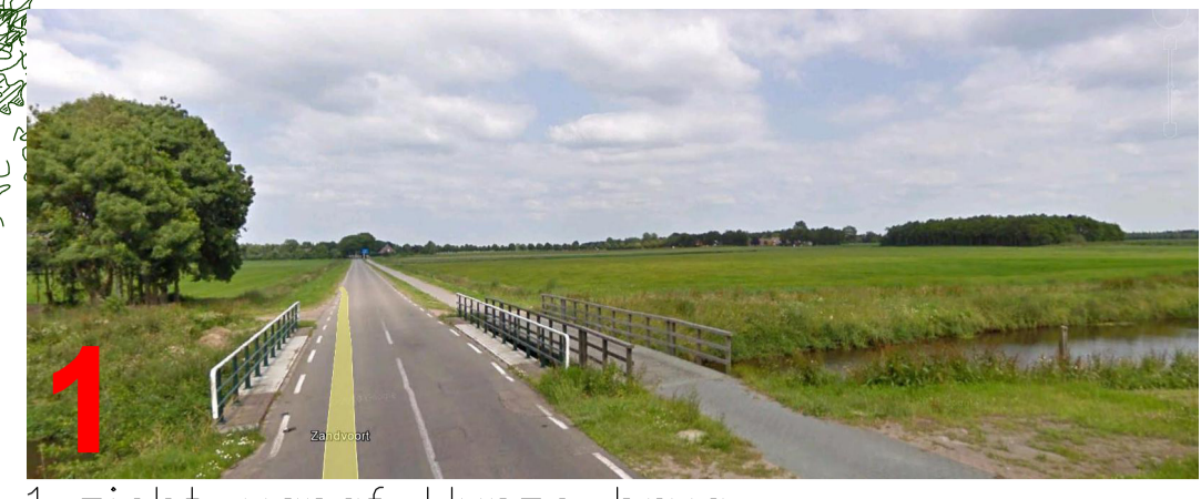
1 zicht vanaf Hunze brug