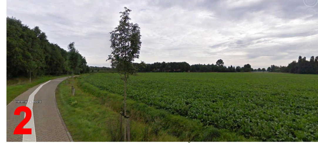
2 zicht vanaf Herenweg noord