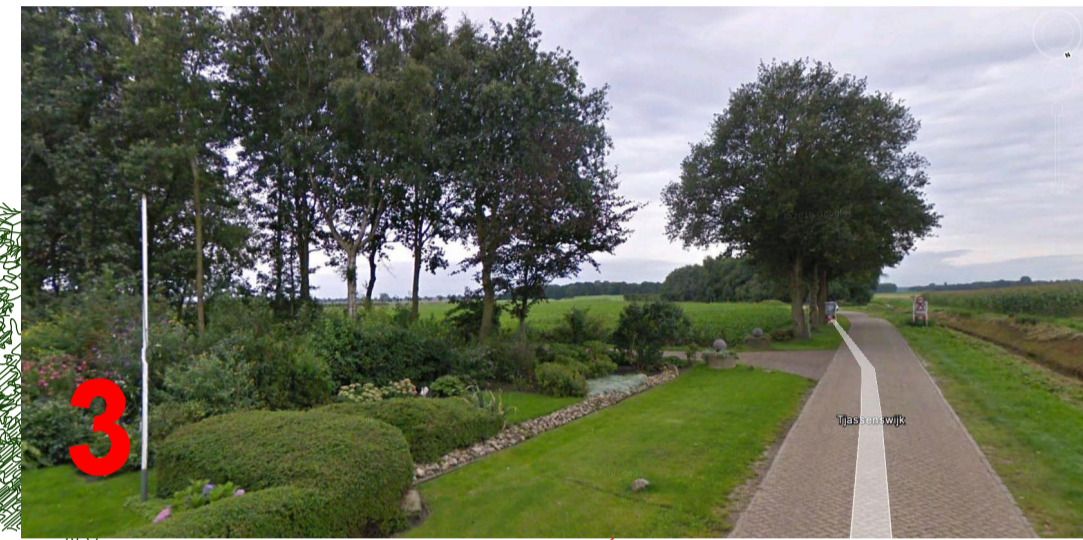
3 zicht vanaf Gieterveen Tjassenwijk 2

bestaande Eiken passen de nieuwbouw goed in! handhaven evt bijplanten